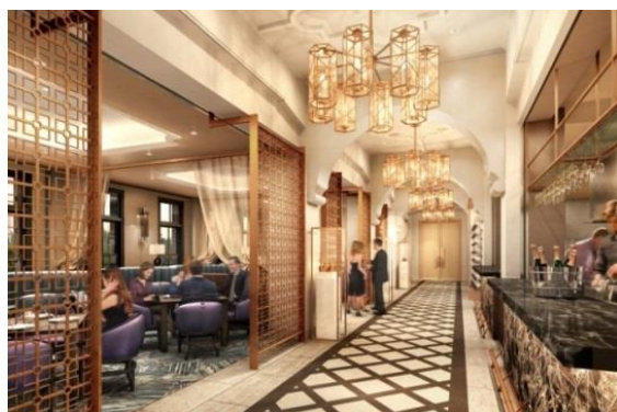
crossfield with TERRACE LOUNGE (2階)