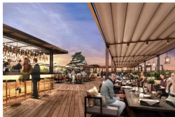
BLUE BIRDS ROOF TOP TERRACE (屋上)